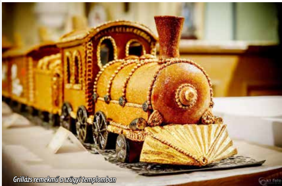
Grillázs remekmű a szügyi templomban

Hatvanöt méter hosszú grillázs vonat a műfaj diadala!