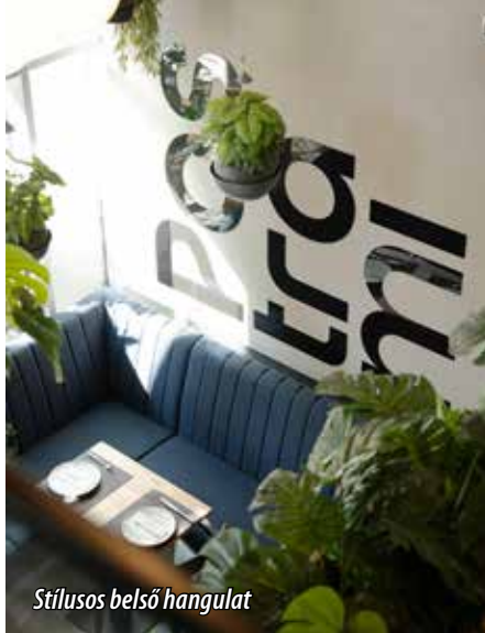
Stílusos belső hangulat

- Kiváló fiatal szakemberekből áll a csapatunk – kezdi válaszát. – Sokan közülünk vidéki kötődésűek, így a profi szaktudás mellett magukkal hozták régiójuk értékeinek ismeretét és szeretetét is. Folyamatosan csiszoljuk tudásunkat, nyitottak vagyunk a különböző régiók gasztronómiai és borászati értékeire. A legutóbbi csapatépítőnk során