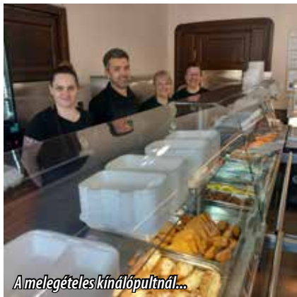
A melegebbétes kínálópultnál...