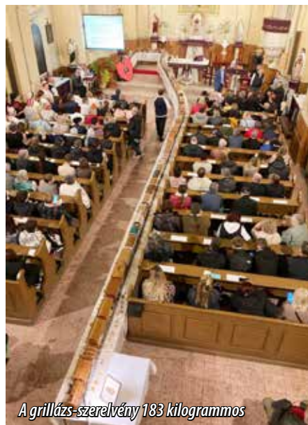
A grillázs-szerelvény 183 kilogrammos