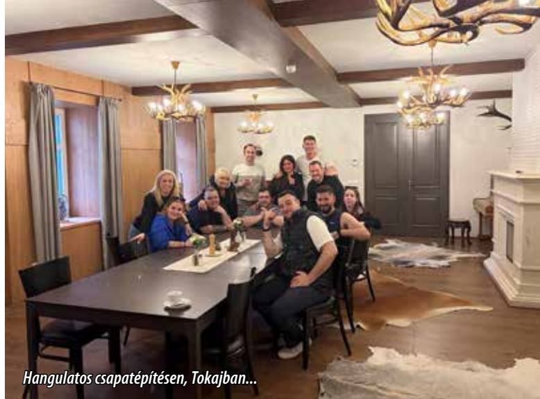
Hangulatos csapatépítésen, Tokajban...

- Mi mindig is törekedtük arra, hogy ne csak jót egyenek-igyanak a hozzánk betérők, hanem egy kicsit úgy érezzék magukat, mintha egy családi ebédre, vacsorára érkeztek volna. Legalább ennyire fontos, hogy a finom ételek mellett a kiszolgálás is profi legyen, ezáltal a vendégek egy hangulatos légkörben élvezhetik a nálunk töltött időt. Családbarát hely vagyunk , a felnőttek mellett gondolunk a gyerekek időtöltésére is, akik hamar elunják az asztal melletti ücsörgést. Erre válaszuk: kialakítottunk számukra egy játszósarkot, hogy a szülők nyugodt környezetben tölthessék el azt a pár órát, amíg nálunk vannak.