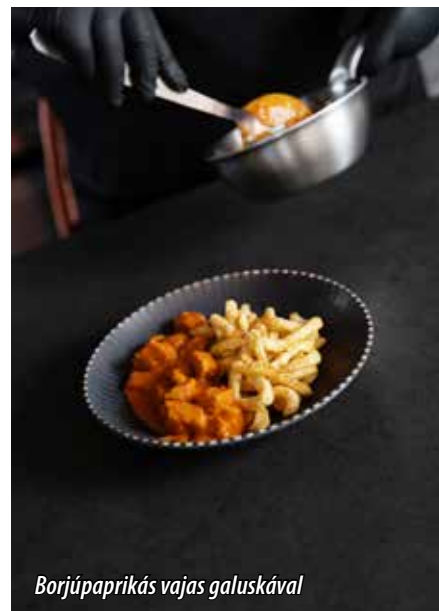
Borjúpaprikás vajas galuskával