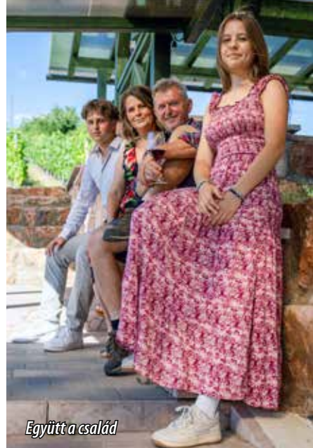
Együtt a család