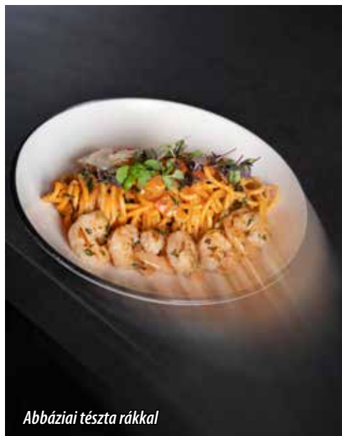
Abbáziai tészta rákkal