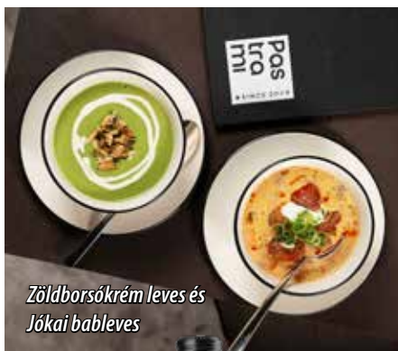
Zöldborsókrém leves és Jókai bableves