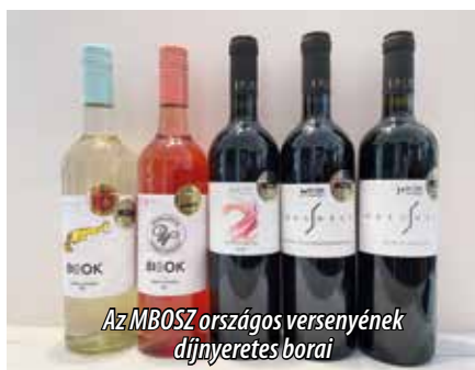
Az MBOSZ országos versenyének díjnyertes borai

séget tagként erősíti! Kötődik ehhez a történelmi, pezsgőgyártó kerülethez, mégpedig úgy, hogy pályafutásának kezdetén, miután elvégezte a neves budafoki Soós István borászati technikumot, több itteni, Törley pincében is gyarapíthatta szakmai tudását. De most itt vagyunk a verőfényes tavaszi délelőttön, amikor körbevezet a boros gazda az egymás mellett kialakított páros pincében és a szemközt található másik objektumon, amely palackérelő és kóstoló helyszín, változott minőségi borok felvonultatásával.