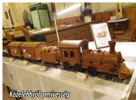
Közelebbről a művesség

Személyes előzményekkel kezdi beszámolóját, az írva, hogy az ő világa nem egy cukrászműhelyben formálódott, alakult, hanem egy konyhában, egy kis piros lábas mellett. A grillázs számára nem egyszerűen egy technika, nemcsak cukor, dió és forma. Több: türelem, alá-