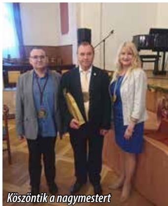
Köszöntik a nagymestert