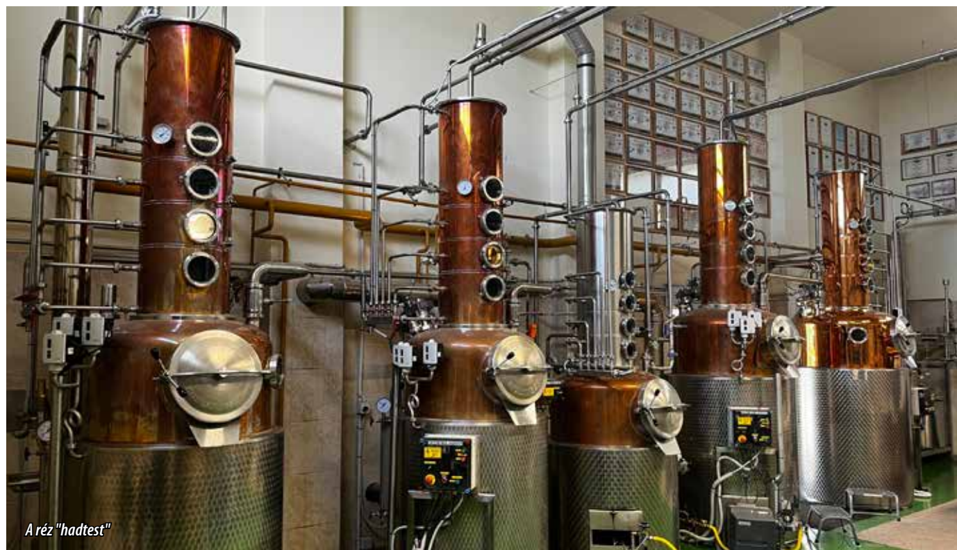
A réz "hadtest"