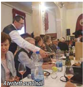
A terített asztalnál