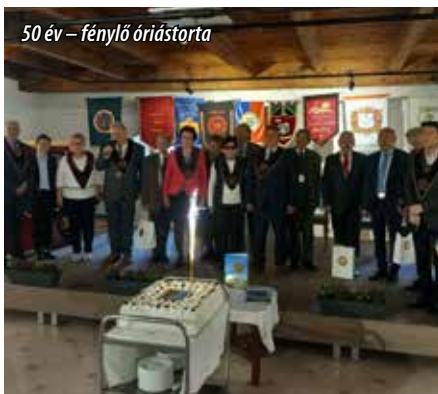
50 év – fénylő óriástorta

Varga Zsuzsanna. Fotók: Szócs László, Dinnyés Ferenc, valamint a képek az egyes borrendektől származnak, előzetes kiválasztás alapján. Fontos megjegyeznünk, hogy szerkesztési elv volt, hogy az egyes borrendek bemutatkozó anyagát az adott közösség állította össze, ahogy jeleztük kép és egyéb grafikai illusztráció kíséretében. A tartalmi hitelesség így biztosított, ha pedig így tekintünk erre a történelmi összefoglalóra, az egész borrendi mozgalom összefogásából született meg ebben a műfajban negyedik kötetként! Még azok számára is tanulságos visszatekintés a borlovagok történetét összefoglaló veretes Album, akik a honi közösségek hatalmas tárházának történelme iránt érdeklődnek. A borrendiségről pedig az ifjabb korosztályok számára is érdekes üzenetekkel szolgálhat a kiadvány. Érdemes azonban az album bevezető oldalain megjelent köszöntőket is elolvasni, amelyekből ezúttal a tudósító rövid idézeteket emel ki: