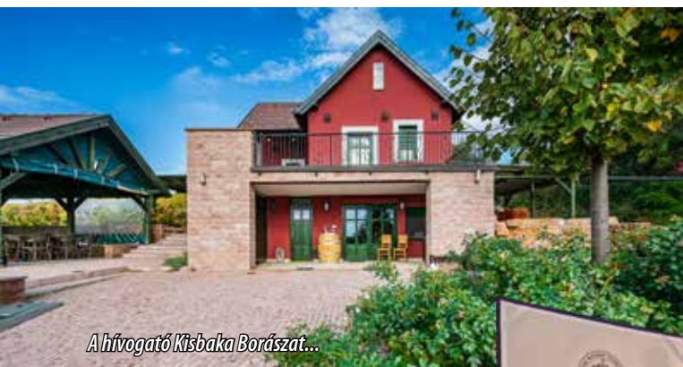
A hívogató Kisbaka Borászat...

- A négy esztendővel ezelőtti beszélgetésünk óta szőlőink és gyermekeink is tovább növekedtek - utal az idő teltére. - A második körben eltelepített ültetvények is termőre fordultak, a gyermekek pedig még többet segítenek a családi gazdaság működtetésében. 6.5 hektár saját és bő 1 hektárnyi bérelt területen gazdálkodunk , s évente nagyságrendileg 150 hl bort készítünk. Amikor tíz esztendővel ezelőtt belevágtunk a szőlőtelepítésbe, ak-