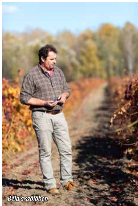
Béla a szőlőben

A MAGYARORSZÁGI BORRENDEK ORSZÁGOS SZÖVETSÉGE ÁLTAL MEGHIRDETETT II. KÁRPÁT-MEDENCEI NEMZETKÖZI BORVERSENYEN FEHÉRBOR KATEGÓRIÁBAN A KECELI DŰNE BORBIRTOK DŰNE-SELECTION IMREHEGYI RAJNAI RIZLING (2022) NYERTE A NAGYARANY FOKOZATOT. A KITŰNŐ BORÁSZT ELŐBB A KEZDETEKRŐL KÉRDEZTE AZ MBÉ MAGAZIN.