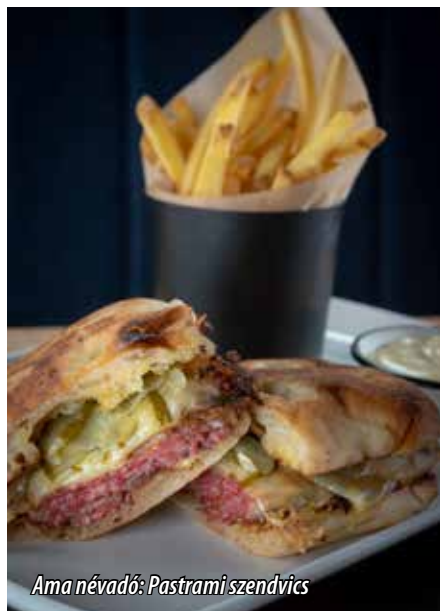
Ama névadó: Pastrami szendvics