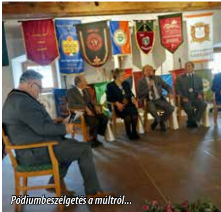
Pódiumbeszélgetés a múlttól...