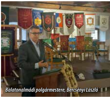
Balatonalmádi polgármestere, Bercsényi László