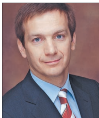
Bajnai Gordon önkormányzati és területfejlesztési miniszter

mesterséges életben tartásától, és nem célszerű a presztízsbetűhöz hasonló támogatás sem. Olyan cégeket támogatunk az adófizetők pénzéből, amelyek a gazdaság szekerét is gyorsabban húzzák. A mai napig körülbelül 2100 nyertest hirdettünk a Gazdasági Operatív Program és a KMOP keretében. Az eddig eldöntött 40 milliárdnyi támogatás közel 200 milliárd forint volumenű vállalati beruházást tesz lehetővé. Ez már országosan is érzékelhető szint. Az uniós forrásokat nem szabad összekeverni a szociális juttatásokkal. Magyarország a második gazdasági szerkezetváltás előtt áll.