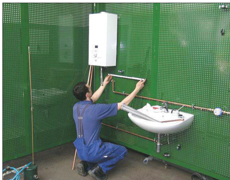
Szakemberek tízezreit képezte a falai között a szakiskola

Jó, hogy olyan sok gyerek vett részt, sokan látták, milyen sokféle szakma van, és milyen érdekes lehetőségek állnak előttük – mondja az igazgató. – Meg kellene találni a módját, hogyan lehetne visszahozni azokat a szakmákat is, amelyekből ma már szinte nincs is képzés, például évek óta nem képezünk kádárokat, pedig biztosan szükség lenne rájuk.