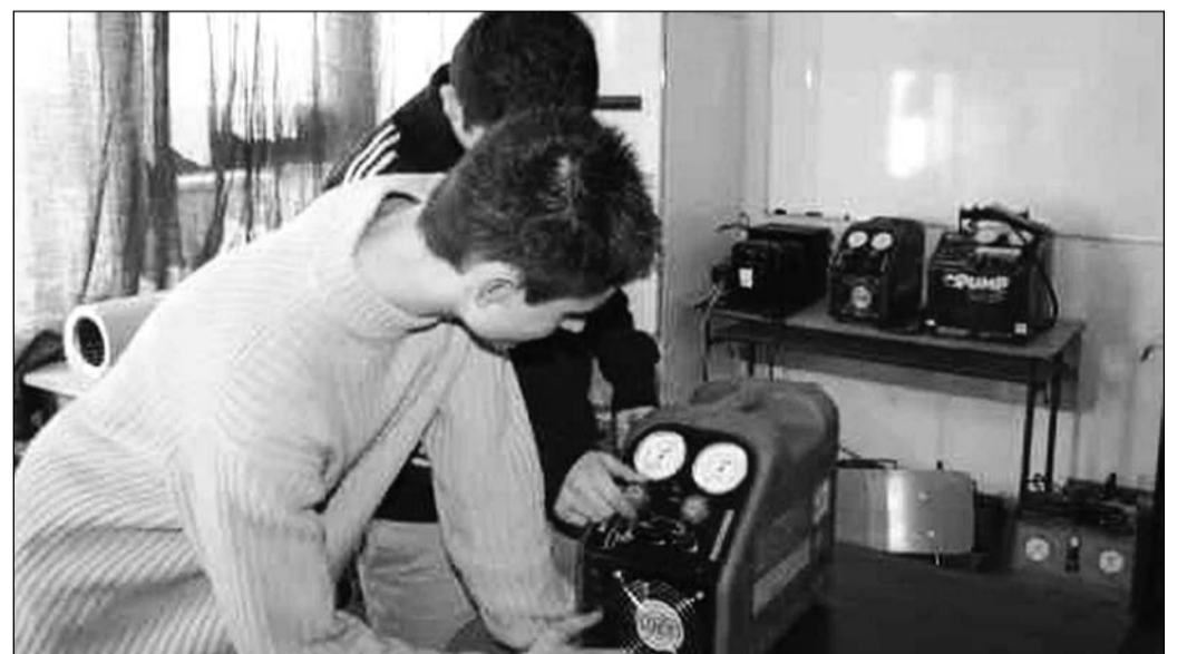
A villamos szerelési anyagokkal ismerkednek a tanulók

szervezésében először a Hungexpo területén nagyszabású fesztivál keretében zajlott a verseny, amelynek csaknem tízezer látogatója volt. Ezért a versenyt cégünk is a korábbiaknál nagyobb összeggel szponzorálta – hangsúlyozta az ügyvezető igaz-