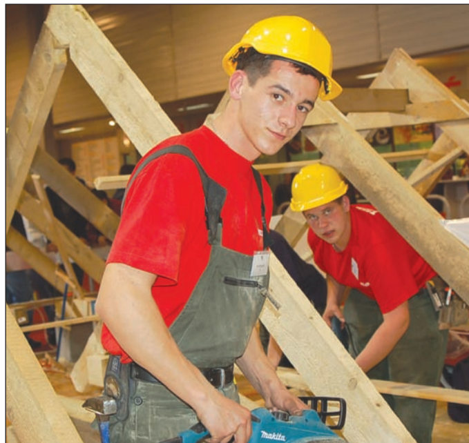
Az ács tanuló állványozás közben

elmondhatjuk, hogy a Regionális Fejlesztési és Képzési Bizottság határozata alapján a fejlesztési forrásokkal támogatható szakképzések listáján is az első helyeken állnak éppen azok a szakmák, amelyekben a szakma kiváló tanuló mérték össze tudásukat.