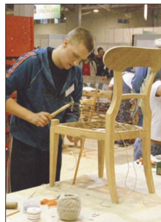
A faipar különféle szakmáira képezik a diákokat

Azt is javasolják, hogy a területi szervezeteket megfelelő információkkal lássák el, és pontosan ismertessék meg őket a versenyszabályzattal. Ennek hiányából a legutóbbi verseny során adódtak konfliktusok. De