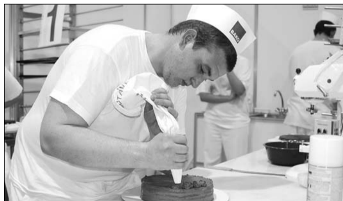
Cukrásztanuló tortakészítés közben