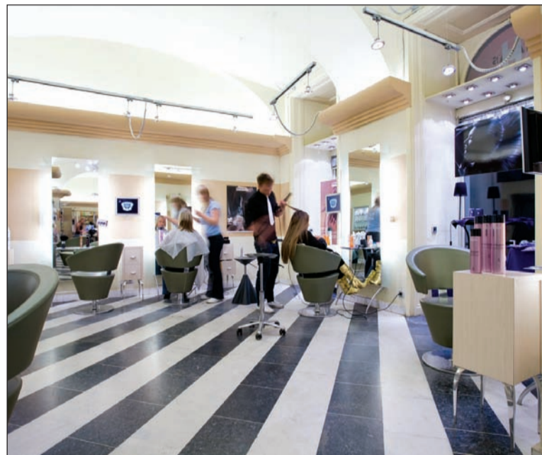
Az összetett szakma sokféle képességet és nagy tudást igényel

szalonokban, amelyek felismerik a folyamatos képzés fontosságát, és investálnak a dolgozóik és tanulóik továbbképzésébe. Ebben a szakmában a folyamatos tanulás és megújulás képessége elengedhetetlen a sikerhez, hiszen a vendégek igényei is folyamatosan változnak. A fodrászat nagyon szorosan kötődik a divathoz, ami egy állandóan változó, fejlődő terület, és ezzel lépést kell tartaniuk azoknak a fodrászoknak, akik sikeresek szeretnének lenni. Az üzletek számára is fontos, hogy a munka-