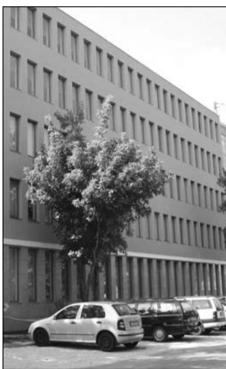
A Schneider Electric központja

A Schneider Electric Hungária Zrt. központjában minden évben megszervezzük az úgynevezett