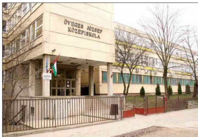
Több mint 300 fiatal vesz részt szakmunkás- és technikusképzésben

Örültünk, hogy a programban szakképző intézmények, a fővárosi TISZK-ek is lehetőséget kaptak a bemutatkozásra, köztük az Öveges és a Dél-budai Szakképzési Központ.