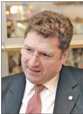
Parragh László, az MKIK elnöke

– Egyrészt a várakozásainkat meghaladóan nő a versenyekre jelentkezők és résztvevők száma, az idén 2700 diák jelentkezett a Szakma kiváló tanulója versenyre, s közülük 110 iskolából 224 versenyző mutathatta meg tudása legjavát a közönségnek az országos döntőben. Fantasztikusan jó, izgalmas és mégis felszabadult, abszolút fiatalos volt a rendezvény hangulata. Nem véletlen az sem, hogy ez a látogatók, érdeklődők száma évről évre nő, az idén már becsülésünk szerint 12 ezren voltak kíváncsiak – nagy örömmünk-