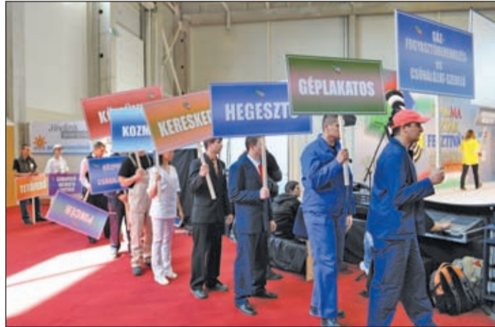
A látványos fesztivál egyik támogatója a Roto Elzett Vasalatkereskedelmi Kft. volt

vezetővel együtt igyekezünk aktívan részt venni a Szakma Kiváló Tanulója Versenybe nevezettek felkészítésében. Meggyőződésünk, hogy sokkal könnyebb fiatal szakembereket képezni, mint a már berögzült rossz szokásokon később javítani. Természetesen cégünk magát a rendezvényt is támogatja. Annál is inkább, mert reményeink szerint e nemes vetélkedő is felkeltheti a fiatalok figyelmét az ács mesterség szépségére, s elősegítheti, hogy a jövőbeli ácsok/tetőfedők büszkék legyenek a szakmájukra.