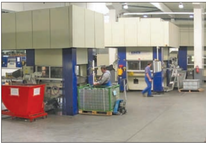
Az OBO-Bettermann globális vállalatcsoporttá fejlődött

– Három éve kisérem figyelemmel e nemes vetélkedőket. Mindhárom évben a cégünk kiemelt szponzoraként vett részt a versenyben első helyezett villanyszerelő diák és felkészítő tanára részére 100-100 ezer forint értékű jutalmat biztosítottunk, ami háromnapos gyárlátogatást foglal magába a német anyacég mindenki központjában, teljes ellátással.