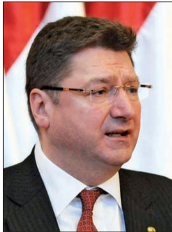
Parragh László, az MKIK elnöke

– Azt gondoljuk, ezek az érvek elegendőek ahhoz, hogy a feje tetejéről a talpára állítsuk a szakképzést. Nagyon fontosnak tartjuk, hogy a szakképzésben teret kapjon a munkára nevelés, sokkal nagyobb hangsúlyt kap-