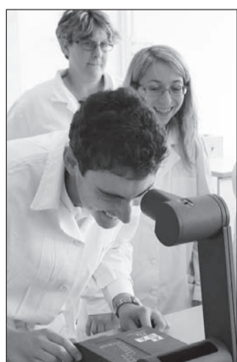
Az új laborok egyikében a műszereket próbálják ki a tanulók

Az MKIK és a Nemzetgazdasági Minisztérium közös, fővárosi Szakképzési Tanévnitője alkalmából adták át azt a beruházást, amelynek révén megújult a Petrik Lajos Két Tanítási Nyelvű Vegyipari, Környezetvédelmi és Informatikai Szakközépiskola. A felújítás – az Európai Unió támogatásával – közel egymilliárd forintba került.