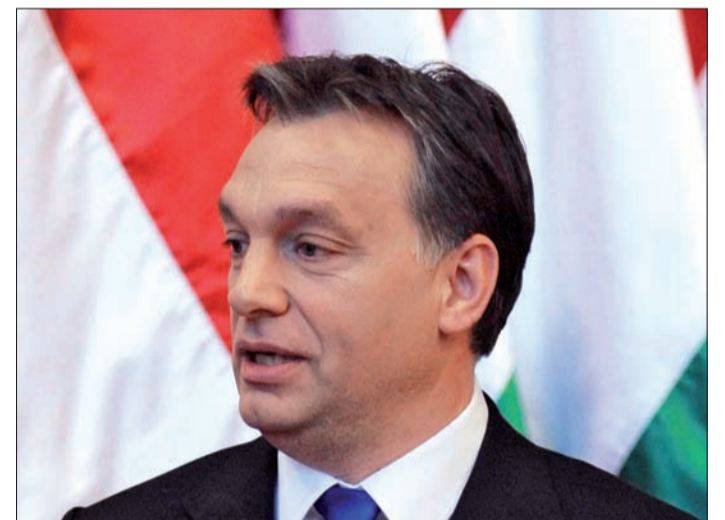
Orbán Viktor miniszterelnök

– Magyarországnak megújulásra van szüksége, ezen belül megújulásra van szüksége a magyar gazdaságnak is! – hangsúlyozta. Ehhez természetesen a maga területén mindenkinek látnia kell a teendőit. A megújulás nem úgy képzelhető el, hogy a magyar politika megmondja a magyar gazdaságnak, hogyan kell megújulni, de ez fordítva sem elképzelhető. Mindenki a saját háza táján végezze el azt a munkát, amit ehhez el kell végezni. A következő egy évben a mi feladatunk, hogy az adórendszert átalakítsuk, a felesleges bürokráciát leépítsük és egy tényleges, tettekben és dönté-