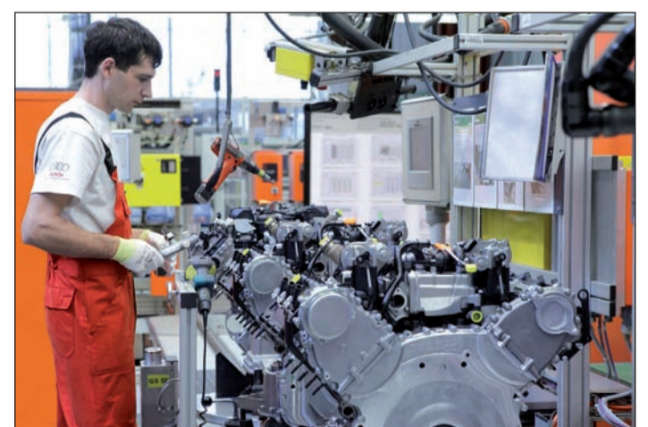
Figyelmet fordítanak az utánpótlás nevelésére az Audinál

Lépéselőnye ellenére az Audi örömmel fogadja, hogy a következő tanévben széles körben bevezetik a duális képzést Magyar-