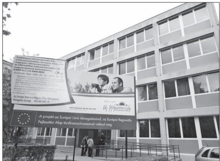
A megújult „Petrik” megfelel a XXI. század kihívásainak

A pályakezdő szakmunkások elhelyezkedési lehetőségei a magyar fővárosban jobbak, mint számos nyugat-európai nagyvárosban. A budapesti szakiskolai végzősök körében a munkanélküliség az országos átlag töredéke. A munkaerőpiac, a munkáltatók igényeinek megfelelően folyik a korszerű képzés, így az itt végzett fiatalok könnyedén találnak szakképzettsgüknek megfelelő munkahelyet, a szakképzés színvonala állja a versenyt Európa nagyvárosaival. A TISZK-ek jelentőségét mutatja, hogy a tervezett 12 integrált szakképző központ közül nyolc már elkészült, és ezekben megkezdődhetett az integrált, gyakorlatorientált szakképzés.