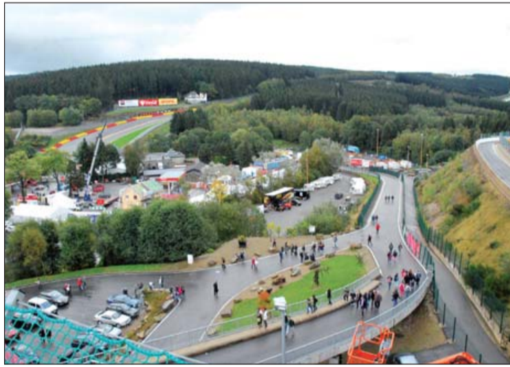
Spa-Francorchamps, az EuroSkills verseny helyszíne