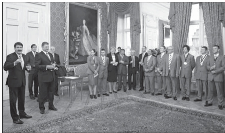
A köztársasági elnök köszönetet mond a versenyzőknek, szakértőknek és szponzoroknak

– Nem, és ez főként azok esetében jelent problémát, akik már befejezték tanulmányaikat és dolgoznak. A nyugat-európai szakmai szövetségek a többféle szakmai felkészítés idejére is tudják biztosítani, hogy a fiatalok megkapják a munkabérlüket. Mi ezt sajnos nem tudjuk finanszírozni, ezért nehezebb a munkába állókat felkészíteni. Van azért egy „trükk”, ami bevált, főként az ács szakmában. Egy francia oktatási intézmény-nyel közösen évek óta szervezünk továbbképzési lehetőséget a már végzett fiatalok számára. A résztvevők napközben a szakmájukban dolgoznak, esténként szakmai továbbképzésen, szombatokonként pedig tan-