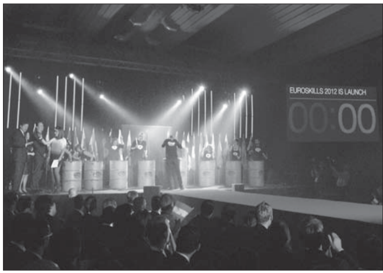
Rajtolt a 3. EuroSkills verseny