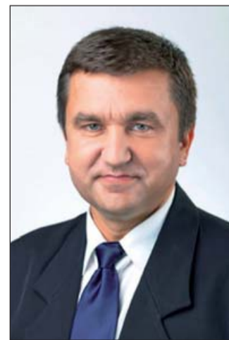
Czomba Sándor foglalkoztatási államtitkár

– Mit tesz a kormány azért, hogy megváltozzon a szakmunkás lét társadalmi megítélése, hogy a fiataloknak megéri szakmát tanulni?