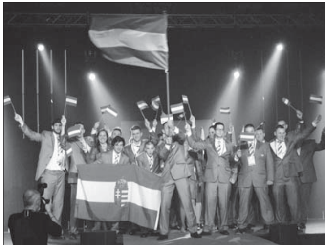
A magyar csapat az EuroSkills 2012 nyitóünnepségén

Rekordot értek el a fiatal magyar szakmunkások az EuroSkills 2012 versenyen: öt arany, egy ezüst, öt bronz és két kiválósági érmet nyertek, s ezzel a hatodik helyet szerezték meg az éremtáblázaton a belgiumi Forma 1-es pályán október 4-6. között lezajlott kontinensviadalon. A szakmák ünnepe volt ez a három nap Spa-Francorchamps-ban.