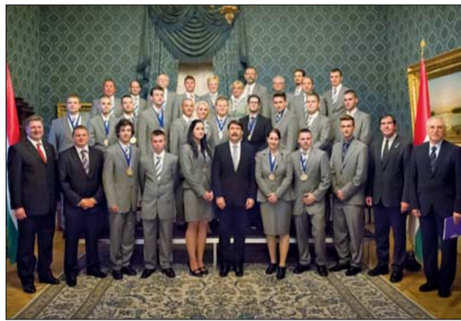
Áder János köztársasági elnök a győztes magyar csapattal

Áder János, Magyarország köztársasági elnöke 2012. október 18-án a Sándor-palotában fogadta az EuroSkills 2012 magyar delegációját, hogy kifejezze elismerését a 23 európai ország részvételével megrendezett szakmák Európa-bajnokságán hatodik helyen végzett magyar fiataloknak és felkészítőiknek. Az államfő a győztesek tiszteletére vacsorát adott a Sándor-palotában.