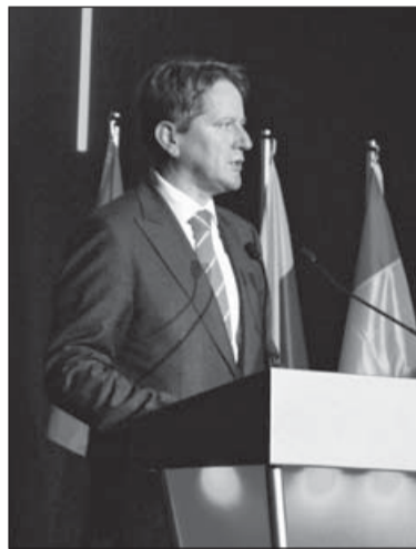
Jos de Goey elnök bezárja a 2012. évi EuroSkills versenyt

Mindenki jól jár a szakmák EuroSkills és WorldSkills versenyével, az ipar, a szakképző helyek, a kormányok, a fogasztók és persze, a fiatal szakmunkások is – vélte Jos de Goey, az EuroSkills elnöke, akivel egybekölt a nemzetközi rendezvény előnyös társadalmi hatásairól, a gazdaság gyorsan változó igényeiről és a magyar fiatalok sikeres szerepléséről beszélgettünk.