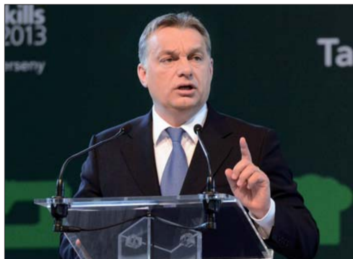
Orbán Viktor miniszterelnök a Szakma Sztár megnyitóján

A Magyar Kereskedelmi és Iparkamara 2013-ban hatodik alkalommal rendezte meg a Szakma Sztár Fesztivált 2013. április 24–26. között Budapesten, a Hungexpo Vásárcsopont G és F pavilonjában. Az MKIK gondozásába átadott 125 szakma közül 39 szakképzésben a nappali tagozaton végzős szakiskolai és szakközépiskolai tanulók számára meghirdetett szakmai versenyek (SZKTV, OSZTV) országos döntőjének ünnepélyes megnyitóján Orbán Viktor Magyarország miniszterelnöke mondott beszédet, majd végigjárta a szakmák standjait és jó teljesítményre biztatta a versenyzőket.