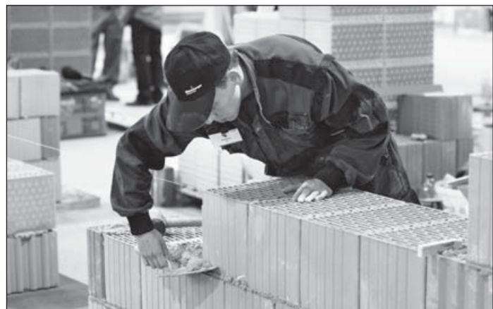
A kőművesek a weber habarcsával falaztak

– Természetesen fontos a vásárlókat, az építkezőket is tájékoztatni, hogy milyen anyagokat érdemes felhasználniuk egy vakolásnál vagy szigetelésnél, de többnyire ők is a szakemberekre, a kőművesekre hallgatnak. A területi képviselőink – akik nemcsak kereskedők, hanem műszaki szakemberek is – ezért járnak a szakiskolákba és gyakorlati bemutatókat tartanak. A szakmunkásoknak is lépést kell tartaniuk a fejlődéssel.