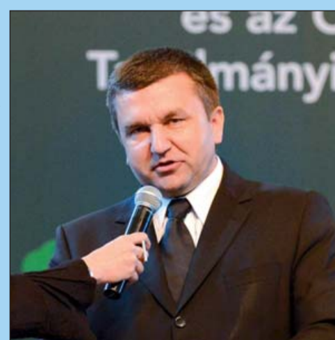
Czomba Sándor foglalkoztatáspolitikai államtitkár