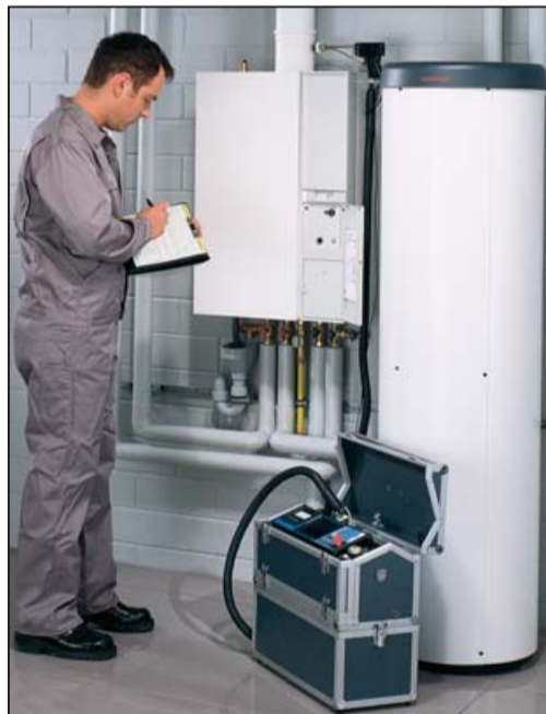
A Weishaupt idén sem hiányzott a fesztiválról

közöket, készülékeket és oktatótáblákat ajándékoztunk, hogy az oktatás ne csak elméleti szinten történjen. Alapvető érdekünk, hogy a szakmunkástanulók a legújabb készülékeket, eszközöket megismerjék. Azt valljuk, hogy a készülék akkor működik a legjobban, ha egy kézben van minden. Tehát a kivitelező szereli le a régi készüléket, s ő ajánlja az újat, amit felszerel, üzembe helyezi és karbantartja. A 0 KW-osról a 28 ezer KW-os készülékig széles választékot gyártunk és szállítunk kis lakásokba, család-