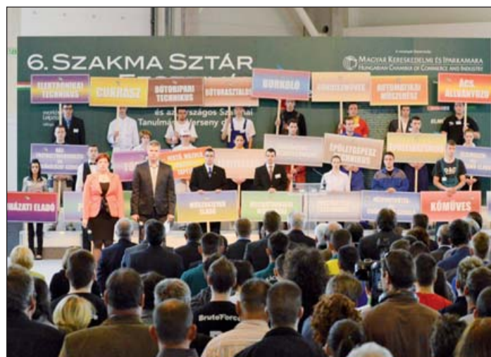
Harminckilenc szakmában zajlott a döntő

Parragh László a szakmai versenyek sikeréről és tanulságairól