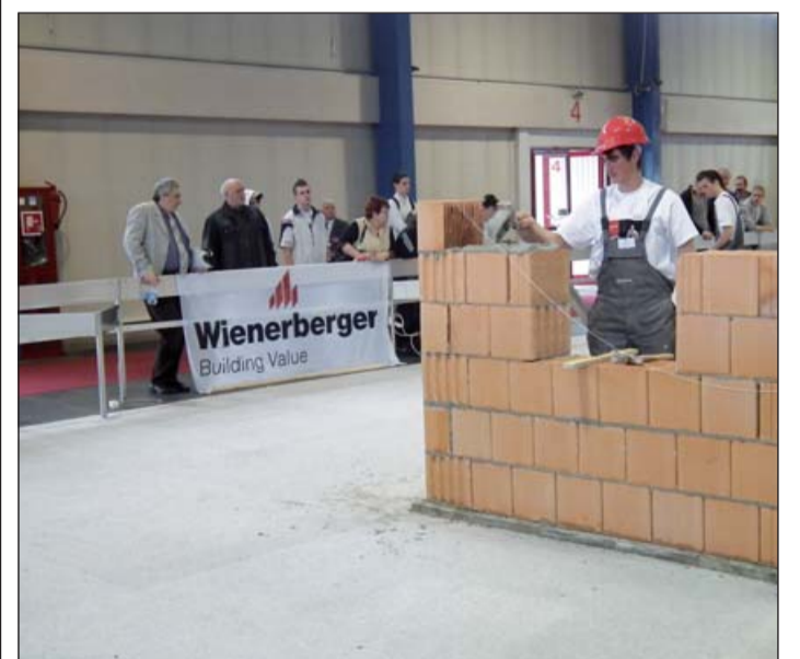
A Wienerberger évek óta támogatja a versenyt

– Az idei versenyfeladatok között is szerepel az új, Porotherm 38 Klíma – innovatív üregszerkezetű téglák, valamint az áthidalók beépítése. Cégünk elsőként vezette be a Porotherm Profi – ügnevezett csiszolt falazóelemeket a magyar piacra. A csiszolt téglák beépítése eltér a hagyományos falazástól. A Wienerberger a kőműves tanuló és a már kőművesként dolgozó szakemberek részére egyaránt ingyenes képzést nyújt a Profi falazási technológia elsajátítására. A Profi falazási technológia nagyon egyszerűen megtanulható, nem igényel speciális szaktudást.