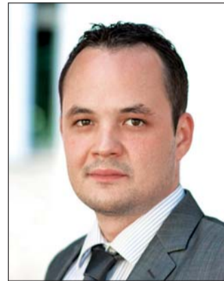
Lenner Áron Márk, az NGM helyettes államtitkára

– Az építőipari ágazat évek óta küzd a láncartozások problémájával. Mostanra a helyzet a beruházások leállításán és a versenyképesség romlásán keresztül a hazai mikro-, kis és középvállalkozások ezreinek létét veszélyezteti, olyannyira, hogy makrogazdasági szinten már a foglalkoztatási mutatókra is negatív hatással van. A kormány felismerte, hogy a folyamat megállítása, illetve újratermelődésének megakadályozása egyértelműen nemzetgazdasági érdek, sürgős és hatékony megoldást kíván. Nem tartható és nem fogadható el az a kialakult gyakorlat, amely a válság által különösen sújtott ágazatban teljesen kiszolgáltatottá teszi, pénzügyileg ellehetetleníti a kkv-kat. A kormány a speciális helyzetre speciális megoldást dolgozott ki, amelyet az idén márciusban törvényjavaslatként benyújtottunk a Par-