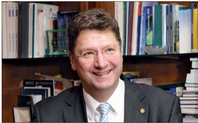
Parragh László, a Magyar Kereskedelmi és Iparkamara elnöke

A láncartozások problémájával a kormányok eddig hiába küzdöttek, nem sok sikerrel jártak. Nem véletlen, hogy a leginkább az építőiparban, de más ágazatokban is egyre súlyosabb gondokat okozó, a válságból való kilábalást fékező helyzetre kamarai szolgáltatás kínál megoldást – hangsúlyozta Parragh László, a Magyar Kereskedelmi és Iparkamara elnöke, aki Teljesítésigazolási Szakértői Szerv felállításáról mondta el véleményét lapunknak.