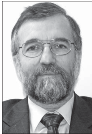
Szaló Péter, a Belügyminisztérium helyettes államtitkára

A kormány kiemelten kezeli a láncartozás elleni küzdelmet, melynek az egyik kulcsintézménye a Teljesítményigazolási Szakértői Szerv. Azonban egy ilyen rendszerben, ahol annyi szereplő van, mint az építőiparban, és ahol minden irányú visszaélés lehetséges, egy kifinomult, összetett eszköztárra van szükség – mondta Szaló Péter, a Belügyminisztérium helyettes államtitkára. A tárca ezért kidolgozott egy több szakmai pillére épülő rendszert. Ennek része a rezsióradíj bevezetése az irreálisan alacsony vállalkozói árak kiszűrésére, a tisztességtelen munkavégzés szankcionálása és az elektronikus építési napló kötelezővé tétele.