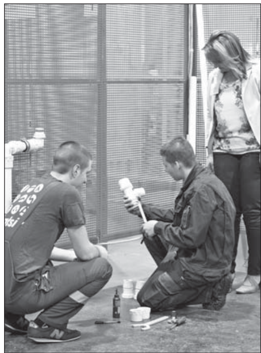
A VIVACO Kft. támogatja a szakképző iskolákat a szereléshez szükséges anyagokkal is

A VIVACO Kft.-t 1998-ban alapították többretegű csőrendszer és szerelvények magyarországi forgalmazására. A cég partnerei szakkereskedő cégek, amelyeknek minőségi épületgépészeti termékeket és szolgáltatást nyújtanak. Kereskedő partnereiken keresztül törődnek a víz-, gáz- és fűtészerező szakemberekkel, ellátják őket a munkájukhoz szükséges információkkal, számukra rendszeres továbbképzéseket szerveznek telephelyükön és a külföldi gyártó cégeknél. Az épületgépészeti tervezők munkájához tervező szoftver hozzáférést és tervező támogatást is tudnak adni. Céljuk: a piac egyik meghatározó csőrendszer és szerelvények kereskedőjeként hosszútávra szóló partneri kapcsolatokban dolgozni. Szakmai munkájuk fontos része a szakképző iskolák, a jövő épületgépészeinek támogatása elméleti és gyakorlati oktatással, szemléltető és szereléshez szükséges anyagokkal, szakmai versenyek szervezésével.