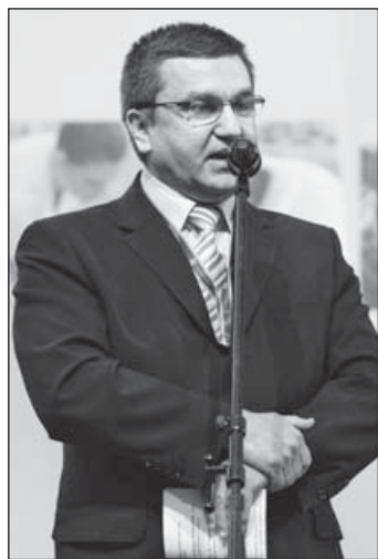
Czomba Sándor, az NGM foglalkoztatáspolitikai államtitkára

A kormány és a kamara fontos célkitűzése, hogy a gazdaságban rendelkezésre álljon a megfelelő minőségű és számú szakember. Ennek érdekében a kormány az elmúlt négy évben megteremtette a megújított szakképzés jogszabályi hátterét, és további finomítással meg lehet erősíteni a duális szakképzést – hangsúlyozta a megnyitón Czomba Sándor, a Nemzetgazdasági Minisztérium (NGM) foglalkoztatáspolitikai államtitkára.