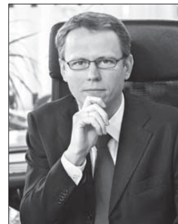
Komáromi Róbert, a Nemzeti Munkaügyi Hivatal főigazgatója

vatal (NMH) standján számos programmal vártuk az érdeklődőket. Több mint 400 tanuló regisztrált a TÁMOP-2.2.2-12/1 kiemelt projekt szakemberei által nyújtott szolgáltatásokra. A résztvevők mintegy fele volt kíváncsi arra, vajon milyen szakmákban teljesítené jól. Ők a standon kitöltött kérdőívek alapján kaptak visszajelzést a szakemberektől, akik a tanulók érdeklődésének és képességeinek figyelembevételével ajánlásokat fogalmaztak meg a hozzájuk legjobban illeszkedő foglalkozásokra. Mindezeket túl a diákok a „Szakma-mozi” kvíz keretében nyolc különböző foglalkozás-bemutató filmet néz-