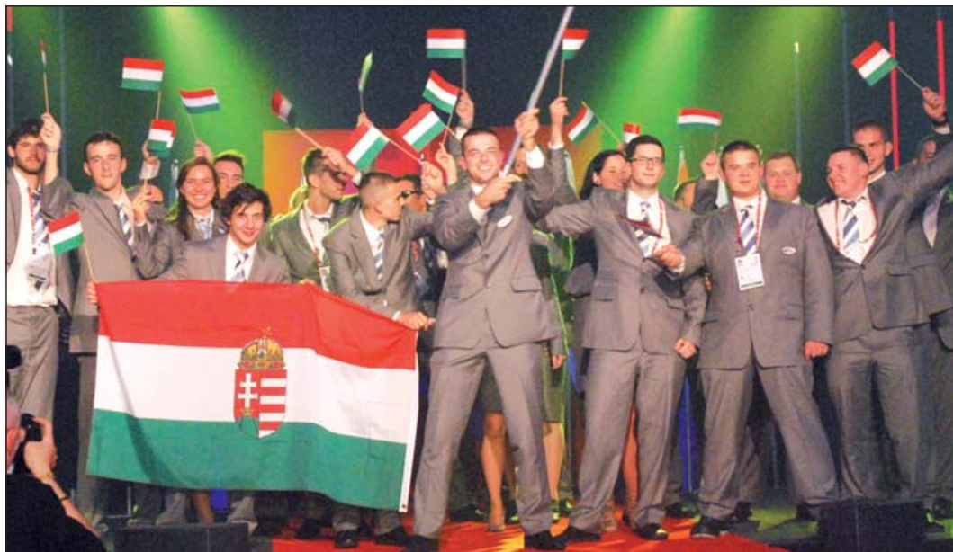
Magyar versenyzők a Belgiumban rendezett EuroSkills-en

automatikai műszerész • bútortipari technikus • elektronikai technikus • erősáramú elektrotechnikus • épületgépész technikus • gépgyártástechnológiai technikus • kereskedő • magasépítő technikus • mechatronikai műszerész • vendégglós.