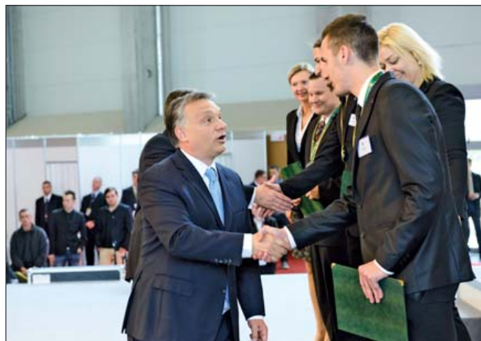
A nyerteseknek Orbán Viktor miniszterelnök gratulál

A belgiumi sikerekre építve, a szakképzésben jelenleg is zajló változások, valamint a szakmunkás pálya népszerűsítésének egyik eszközeként a kamara 2013 decemberében, a térségben elsőként pályázta meg a 2018-as EuroSkills megrendezésének jogát. A EuroSkills Budapest 2018 verseny a magyar kormány teljes körű támogatásával valósul meg.