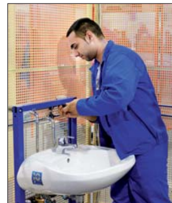
A cég évek óta támogatja a versenyt

Jól vizsgáztak a technikusok. A versenyhez a vízmelegítőn kívül minden berendezést mi biz-