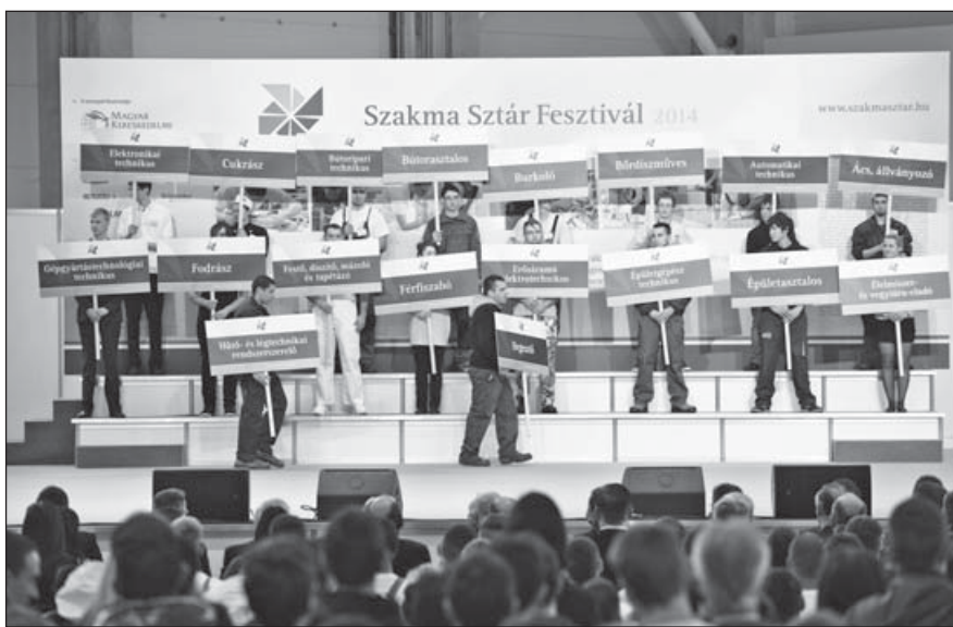
A fesztivál nyitóünnepségén a szakmák felvonulása

A EuroSkills azért is érdemel figyelmet, mert Magyarország megpályázta a 2018-as verseny rendezését. Várhatóan május elején születik döntés arról, hogy Norvégia vagy Magyarország kapja meg ezt a jogot. A kormány állami garanciavállalással növelte a magyar esélyeket.