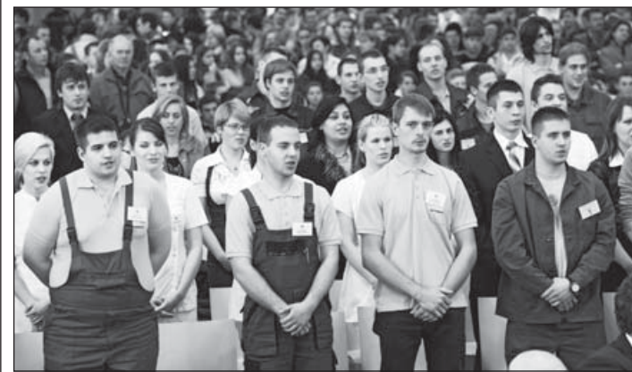
Ünnepélyes pillanat a megnyitón

– Szakmát tanulni mindenképpen érdemes! A duális képzés nagy előnye, hogy a tanulók szakmai, elméleti ismereteiket a szakképző iskolákban sajátítják el, gyakorlati oktatásuk pedig a gazdálkodó szervezeteknél zajlik, így versenyképes szakmudást szerezhetnek. A duális szakképzés azonban – azon túl, hogy ingyenes, gyakorlatias, munkahelyekhez kapcsolódó, esélynövelő – már diákként is pénzkereseti lehetőséget jelent, később pedig állandó, jó keresetet biztosít. Azok a diákok, akik hiányszakmát tanulnak, akár havi nettó ötvenezer forintot is kaphatnak: ennyi lehet az összege a tanulmányi ösztöndíjnak és tanulóit juttatásnak együttesen. A hiányszakmákban a jó szakemberek képzés utáni keresete – például az esztergályosoké, a mechatronikai műszerészeké – negyven-ötvenezer forinttal magasabb lehet a szakmunkás átlagbérnél.