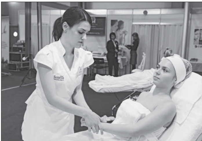
Az Alveola a kozmetikusok számára az összes eszközt biztosította a versenyen

– Majdnem minden márkánkat szakoktató képviseli: őket azok közül a kozmetikusok közül választjuk ki, akik a szakmájukban kiemelkedően dolgoznak. Tehát van nálunk lehetőség a fiatalok számára.