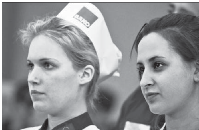
A BAKO Hungaria Kft. számára is fontos az utánpótlás

– A BAKO Hungaria Kft. neve jól ismert a pék- és cukrász szakmában, hiszen a cég több mint két évtizedes múltra tekint vissza a hazai piacon. 1991-ben a németországi, Baden-Württembergi tartományi szak-