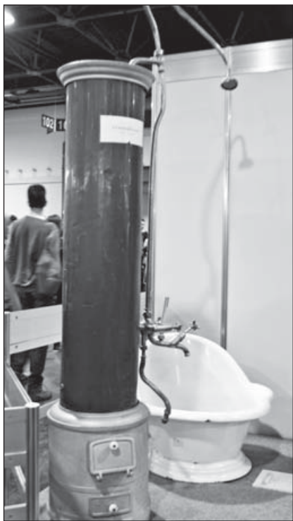
Az Épületgépészeti Múzeum sokakat vonzott