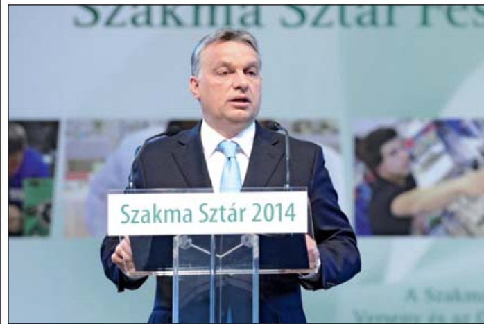
Orbán Viktor miniszterelnök a fesztivál záróünnepségén

Aki már tizenévesen egy szakma sztárja, az jó úton halad afelé, hogy sikeres ember legyen – ezzel a gondolattal indította köszöntőjét Orbán Viktor miniszterelnök, aki idén is ellátogatott a Szakma Sztár Fesztiválra. Ezúttal az eredményhirdetésen gratulált a verseny minden közreműködőjének, s személyesen köszöntötte a legjobbakat díjátadás-kor a színpadon.