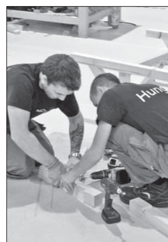
A fiúk jól kihasználták a versenyidőt

Európa harmadik legjobb ács csapata 2014-ben a magyar