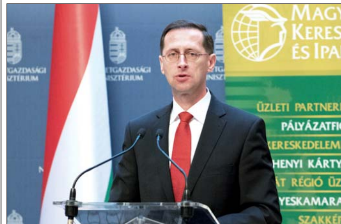
Varga Mihály nemzetgazdasági miniszter

– Sokkal több kiváló szakmunkásra és technikusra van szükség a magyar gazdaság fejlődéséhez, mint amennyit a jelenlegi oktatási rendszer képez – hangsúlyozta Varga Mihály nemzetgazdasági miniszter a EuroSkills magyar nyerteseinek tiszteletére rendezett ünnepségen a Nemzetgazdasági Minisztériumban.