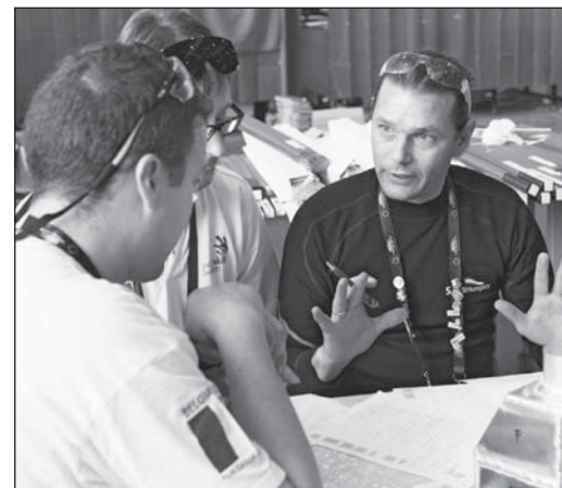
A Mátrai Hegesztéstechnikai és Szakképzési Kft. képzési vezetője a versenyzőkkel