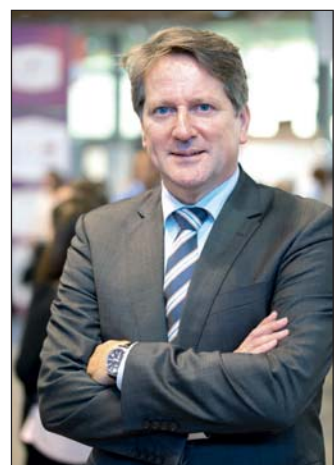
Jos de Goey, a WorldSkills Europe elnöke

– E valós probléma megoldására a munkahelyteremtés az egyik lehetősége. A versenyek