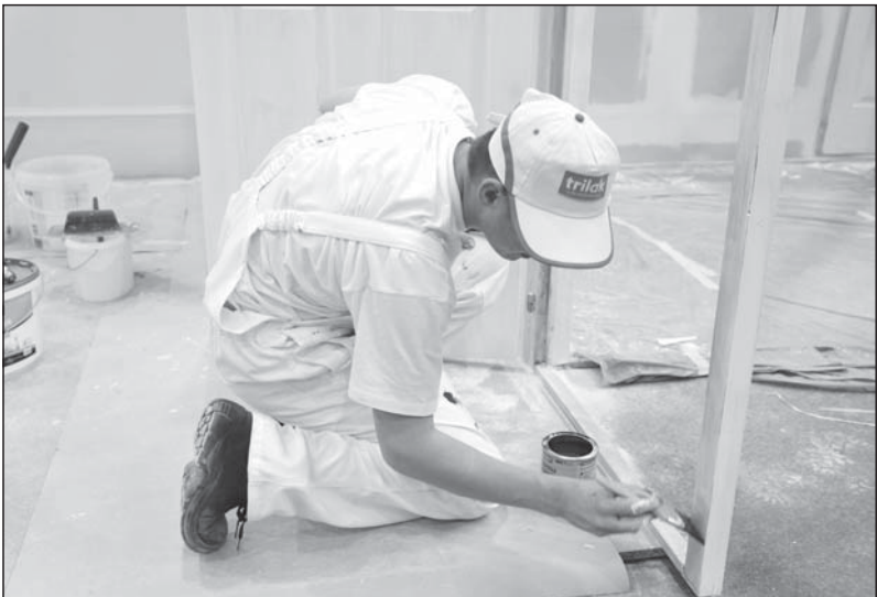
A Trilak negyedik alkalommal szponzorálja a versenyt

– Az utóbbi időben például sok az újítás a tapetáknál. A papír anyagú helyett egyre inkább átveszi a viasz tapéta – emelte ki. – A festékeknek a környezetbarát vizes termékek kezdik az oldószeres fajtákat kiszorítani. Hogy ez mennyire erőteljes folyamat, azt mutatja, hogy például a EuroSkills-n tilos oldószeres festéket használni. Egyre szigorúbbak az európai uniós szabályok a festékekkel. A Trilak fokozottan törekszik ezek betartására: az uniós szabályoknak megfelelően fejleszti a gyártást és bővíti a kínálatát. Sőt, a jövőben a szponzorációt is szélesíteni kívánják – tudtuk meg a cégvezetőtől.