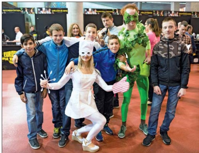
A szuperhősök gondoskodtak a hangulatról

lánban nyolc pontot kapott rendezvény, ami komoly elismerés. A megkérdezettek többsége azért jött el a programra, mert pályaválasztás előtt áll, és szeretett volna valami ötletet vagy iránymutatást kapni a látottakból, illetve a jelen lévő szakemberektől. A nagy érdek-