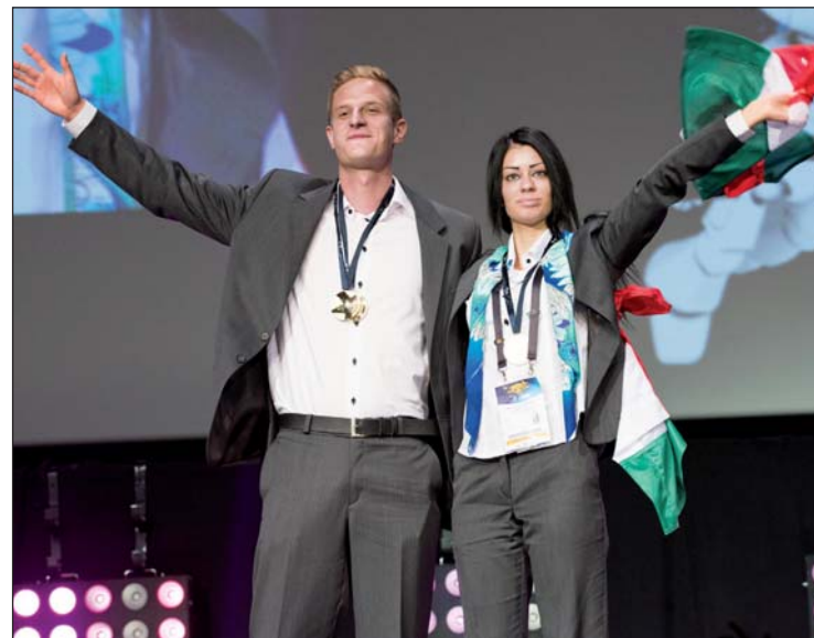
Nagy meglepetést okoztak a karbantartó és felülettisztító specialisták