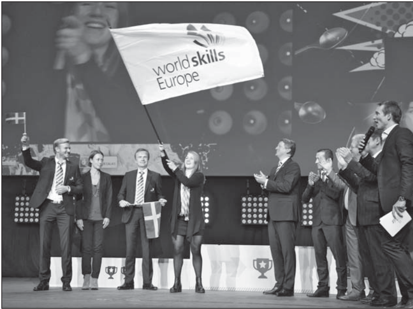
Az ötödik EuroSkills házigazdája, Svédország képviselői átveszik a franciáktól a zászlót

500 ezer lakosával Stockholm után Svédország második legnagyobb városa. Előnyös földrajzi elhelyezkedésének köszönhető, hogy itt van a legnagyobb kikötő Skandináviában. Fejlett iparral (SKF, Volvo, Ericsson) is rendelkezik, így az ország egyik gazdasági központjaként tartják számon.