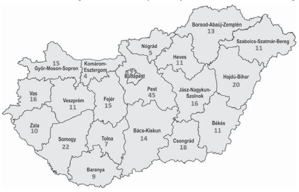
A beadott kérelmek megoszlása a vitatott teljesítés helyszíne szerint 2015. november 30-ig

Mind a kérelmező székhelyét, mind a vitatott teljesítés helyszínét tekintve jól látható, hogy a budapesti és a Budapest környéki ügyek száma a legjelentősebb. Mostanra nem maradt olyan megye, ahonnan nem adtak be kérelmet. Budapest, Vas és Békés megyékben vannak olyan beruházások, amelyekkel kapcsolatban nem is egy, hanem több kérelem érkezett, az alvállalkozói lánc különböző szintjeiről.