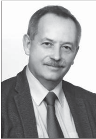
Koji László, az ÉVOSZ elnöke

A jövőben a Teljesítésigazolási Szakértői Szervezethez (TSZSZ) forduló cégek számának növekedésével lehet számolni, ezért roppant fontos, hogy a szakértők száma bővüljön és a díjazásuk is javuljon. Ezt hangsúlyozta Koji László, az Építési Vállalkozók Országos Szakszövetségének (ÉVOSZ) elnöke. Elmondta, hogy az építési vállalkozások elégedettek a testület működésével.