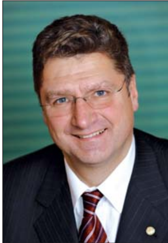
Parragh László, az MKIK elnöke

Néhány évvel ezelőtt a magyar gazdaság súlyos problémája volt a lánc- vagy körbetartozás, amely már fékezte az üzleti folyamatokat. Különösen az építőiparban öltött ez a jelenség szinte kezelhetetlen mértéket. Közbeszéd tárgya volt, újságcikkek sora foglalkozott a témával. Tenni kellett valamit a helyzet megoldására. A kamara az egyik kezdeményezője volt annak, hogy a láncartozások megszüntetésére, felszámolására egyszerre több eszközt kell alkalmazni. Ezek közé tartozott egyebek közt az uniós forrásokhoz való jutás és a hitelezés feltételeinek megváltoztatása, valamint a vállalkozások szűrése, átláthatóvá tétele. Több dolgot indítottunk el, elsőként az építőipari cégek regisztrációját, majd ezt követően a kamarai regisztráció teljes körűvé tétele. Ennek köszönhetően már látjuk a gazdaság valamennyi szereplőjét, tudjuk, hogy kinek mennyire korrekt, tisztességes a piaci magatartása, fizetési fegyelme. Közbeszerzési eljárás azóta nem indulhat olyan cég, amely nincs regisztrálva. A körbetartozás felszámolásának egyik legfontosabb lépése a Teljesítésigazolási Szakértői Szerv létrehozása volt. A szakértői tevékenység ugyanis egyértelművé teszi, hogy valós indokkal nem fizet a megrendelő, vagy csak „mondvacsinált” kifogást