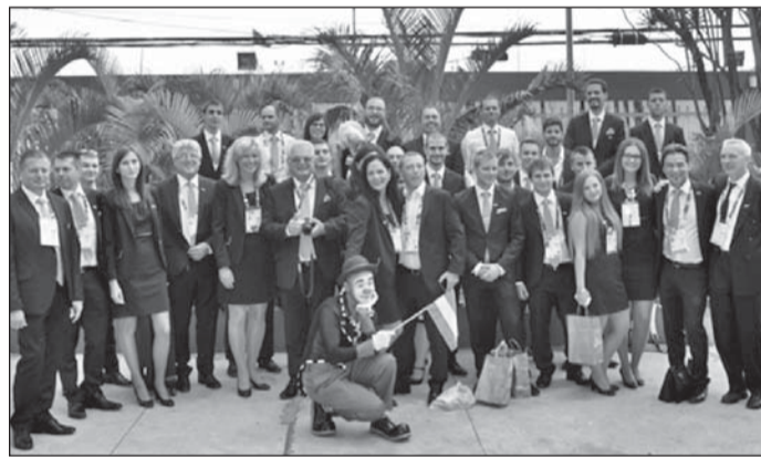
A magyar csapat tagjai

Szavaiból kiderült: a braziliai WorldSkills-t a magyar küldöttség arra is felhasználta, hogy ötleteket gyűjtson a budapesti