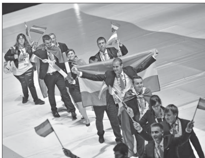
A magyar csapat São Paulóban

Hatalmas munkát igényelt a rendezvény lebonyolítása, s úgy tűnik, alapvetően mindenki – a csapatok és a látogatók is – elégedettek voltak a brazilok munkájával. Akik tényleg megdöbbentek mindent azért, hogy vendégeik jól érezték magukat. Négy napon át 50 szakmában folytak a versenyek a brazil metropoliszban, csaknem 1200 fiatal szakmunkás részvételével.