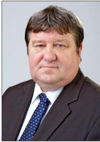
Tállai András, a Nemzetgazdasági Minisztérium államtitkára

– Négy napot tölthettem a jövő legígéretesebb szakemberei között. Bár a résztvevők száma alapján erre már előzetesen számítani lehetett, mégis meglepett a verseny mérete, nagysága. Hatalmas területen majdnem 1200-an versenyeztek. Ahhoz, hogy valamennyi helyszínt végigjárja az ember, több kilométernyi utat kellett megtenni. Elképesztő munkát végeztek a szervezők, hiszen a résztvevők mozgatása, elszállásolása, vagy éppen a versenyhelyszín előkészítése rendkívül összetett feladatot jelentett. Ez utóbbinál például a különböző gépek, szerzők energiaigényének biztosításához a meglévő elektromos energia rendszer mellett további áramfejlesztőket kellett üzembe helyezni. De a Magyar Kereskedelmi és Iparkamara is jelentős szervezési feladatot vállalt magára a magyar delegáció részvételének előkészítésekor. Köszönetet szeretnék mondani mindazoknak, akik a magyar versenyzők kiválasztását, felkészítését, kiutazását megszervezték, illetve a helyszíni szakértői feladatokat ellátták. Elárulhatom, a kedvenc helyszínem azok voltak, ahol a magyar csapat tagjai versenyeztek. Egykori tanáremberként fantasztikus volt látni a fiatalok kitartását, erőfeszítéseit és koncentrációját a négy napos verseny alatt.