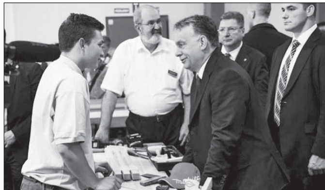
Orbán Viktor az egyik versenyzővel

A vidéki iskolákból, a területi kamarák szervezésében, 200 autóbusszal több mint 9 ezer diák érkezett. Több mint 60 százlékuk 8. osztályos, pályaválasztás előtt álló fiatal volt. A budapesti általános iskolákból további 5000 diák látogatott ki a fesztiválra.