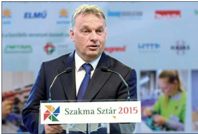
Orbán Viktor a megnyitón

Használható tudást, jövőt kell adni a fiataloknak – hangsúlyozta Orbán Viktor miniszterelnök az idén nyolcadik alkalommal megrendezett Szakma Sztár Fesztivál ünnepélyes megnyitóján. Beszédében kiemelte, hogy a szakmunkástanulók fontosak az ország számára.