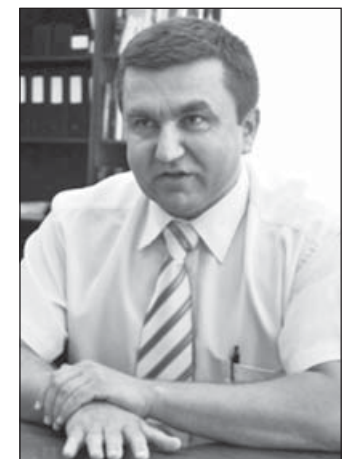
Czomba Sándor, az NGM munkaerőpiacért és szakképzésért felelős államtitkára

– A 2018-ban Magyarországon megrendezendő EuroSkills verseny kiváló alkalmat jelent a megmérettetésen szereplő fiatalok példaképpé emelésében, a szakképzés népszerűsítésében, presztízs értékű lehetőség hazai számára, a szakképzésen túlműtató gazdasági, turisztikai lehetőségeket is magában rejt. A szakképzésben érintetteknek lehetőséget biztosít a nemzetközi színvonal megismerésére,