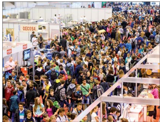
A fesztiválon az idén mintegy 15 000 látogató vett részt

Erdélyi Levente Szabolcs szerkezetlakatos