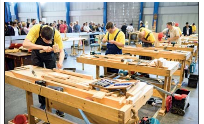
A versenyzőket nem zavarják a nézők sem