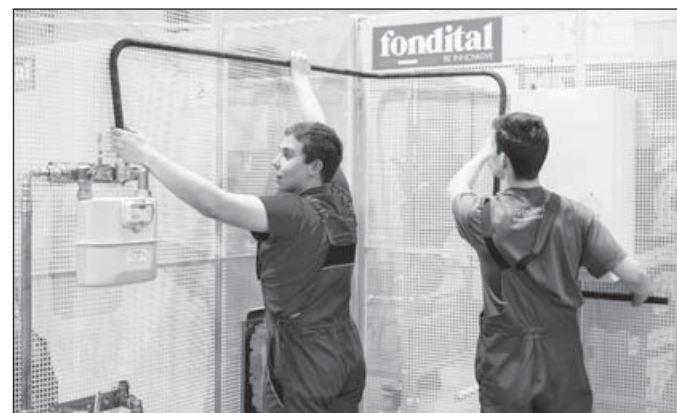
Verseny közben a tanulók

dott magáról elmondani. Fontos, hogy a nemzetközi versenyek legjobbjait fogadja a közvélemény elnöke és a miniszterelnök, ezeknek az eseményeknek mind komoly hírértéke van és én ezt nagyon jónak tartom. Ami az anyagi megbecsülést illeti, emiatt sokan mennek külföldre dolgozni. Azt gondolom, mi megteszük, ami tőlünk telik, a gazdaság szereplőinek is lépniük kell. Tavaly óta ismét beindult az építőipar Magyarországon: várhatóan sokan viszsza fognak jönni azok közül, akik elmentek, ha látják, hogy itthon is meg lehet élni a szakmájukból.