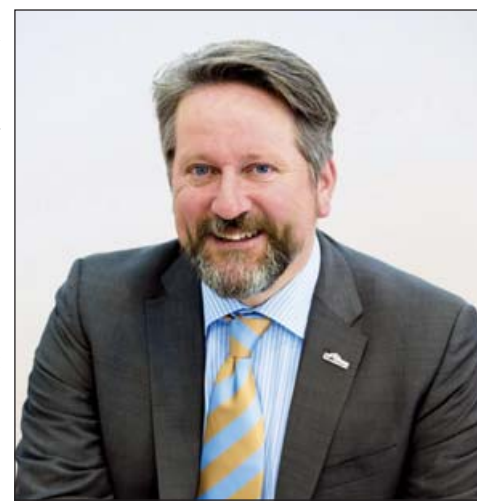
Jos de Goeij, a WorldSkills Europe elnöke

kintjük annak tudatosítását, hogy a szakmák, a szak- tudás fontos szerepet játszanak a társadalom életében és fejlődésében. Bár direkt statisztikáink nincsenek, abban is biztosak vagyunk, hogy versenyekkel világszer- te sok fiatalnak segítünk a pályaválasztásban és az elhelyezke- désben. Nem ritka, hogy verseny- zőink állásaján- latokat kapnak a WorldSkills-t és a EuroSkills-t szponzoráló cé- nektől. Ezek a motivált fiatalok jó példát mutatnak munka- és szakmásteretből, nemes ver- sengésből és kreativitásból. Arra