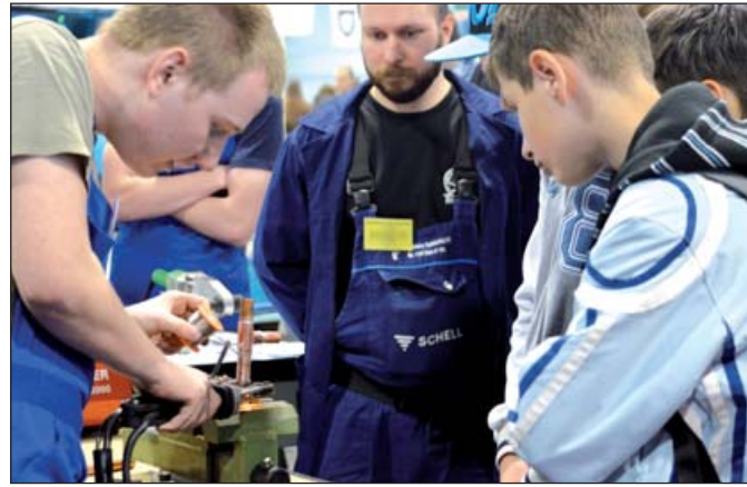
A versenyzőt figyelik a diákok és a verseny segítője

A Vivaco támogatja a versenyt szerelési anyagokkal is, így Valsir WC-tartállyal, Valsir többretegű csőrendszerrel, Valsir Triplus hangcsillapított lefolyórendszerrel, Fondital alumínium radiátorral, Fondital kazánnal és Fondital gázkonvektorral. A tanárokkal együttműködve a cég