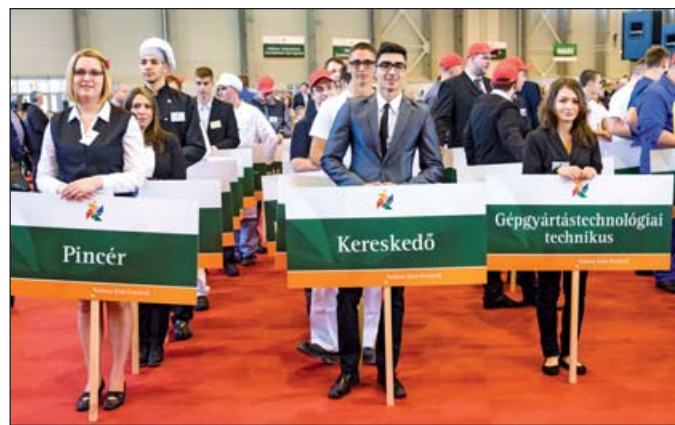
A szakmák felvonulása