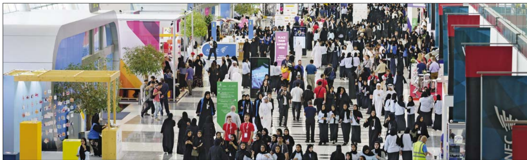
A WorldSkills helyszíne Abu Dhabiban

Elképesztő koncentráció és akarás jellemezte a WorldSkills-en minden idők legnépesebb magyar csapatának teljesítményét. Valamennyi versenyző megértette, hogy komolyan kell vennie a megmérettetést. Az MKIK szakképzési alelnöke leszögezte: a fiatal szakmunkások, a felkészítők és az iskolák mindent megtekinttek azért, hogy a magyar csapat jól szerepeljen a kökemény világversenyen, s ezt sikerült is elérniük.