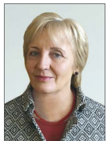
Ambrus Ilona, az NGM gazdálkodásért felelős helyettes államtitkára

– A jövő szempontjából meghatározó, hogy a fiatalok milyen szinten tudják elsajátítani a szakmájukat. A szakképzést illetően ez a legfontosabb tanulság. Már csak ezért is nagyon fel kell készülnünk a jövő évi budapesti EuroSkills versenyre. A fiatal szakmunkások európai bajnoksága ki-