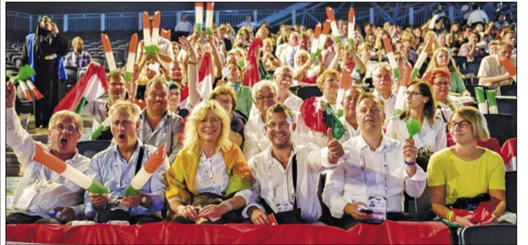
Díjátadó ünnepség a 2017-es WorldSkills-en Abu Dhabiban

– Hogy ha úgy tűnik, hogy velem két tradíció dőlt meg a WSE-ben, egyrészt mert én vagyok az első nő elnök, másrészt mert kelet-európai vagyok, akkor Magyarország is tradíciódöntő, mert az első kelet-európai ország, amely elnyerte a EuroSkills rendezési jogát. Ezzel esélye nyílt arra, hogy bizonyítsa: erős és tudásban hasonlóan felkészült, mint az EU nyugat- és észak-európai tagállamai, kiemelten kezeli az európai színvonalú szakmai oktatás és képzés kialakítását és fontos eszköznek tartja az európai versenyeket a gazdasági növekedéshez és a fenntarthatósághoz, az életbevágóan fontos minőségi képzett munkaerő biztosításához. Biztos vagyok abban, hogy a 2018-as EuroSkills kiváló lesz. Együttel bízom abban, hogy Magyarország példája más országokat is arra készítet majd, hogy csatlakozzanak a WorldSkills Europe-hoz.