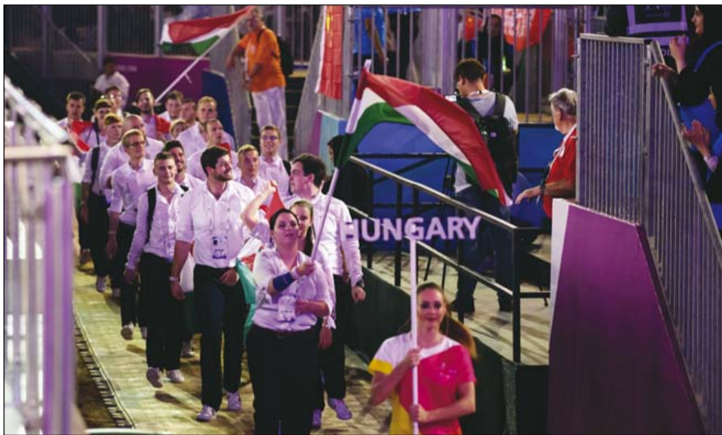
A magyar csapat bevonulása a WorldSkills megnyitóján Abu Dhabiban

A WorldSkills idei versenye azt is jól megmutatta, hogy hol tart a világ és ehhez képest hol helyezkedik el a magyar szak tudás – folytatta az értékelést az MKIK elnöke. A világgazdasághoz hasonlóan a súlypontok a szakképzésben is átrendeződnek. Kína, Dél-Korea, Japán, Oroszország megértette a szakképzés jelentőségét, azt,