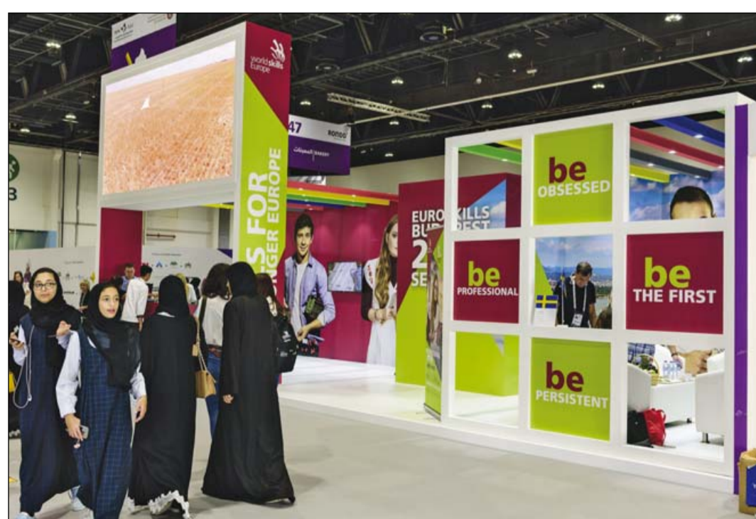
A magyar stand

– Rám legnagyobb hatással a versenyzők voltak Abu Dhabiban. Tervezzük azt is, hogy a tavaly Göteborgban is. Elképesztő, hogy milyen fegyelmetten és odaadással tudnak dolgozni, mennyi energiát raknak bele a munkájukba. Le a kálappal a szakértők előtt is, akik minden feltételt kiharcoltak versenyzőiknek a siker érdekében. Szeretném, ha ilyen lelkes hangulatú verseny lenne a budapesti EuroSkills is.