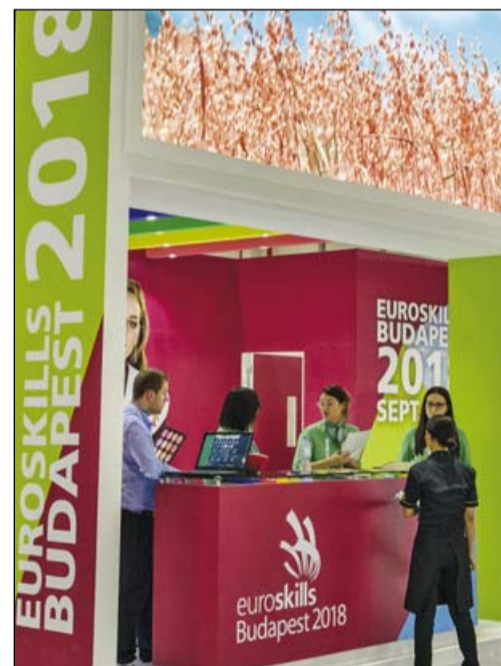
A magyar stand

– A felkészülés a tervezett menetrend szerint zajlik. A verseny megrendezéséhez a Nemzetgazdasági Minisztérium a Nemzeti Foglalkoztatási Alap költségvetéséből biztosít forrást. Már kiválasztották és lefoglalták a verseny, a nyitó és záró rendezvény helyszínét, az érkező versenyzők és vendégek elhelyezését biztosító szállodai helyeket is. Kiemelt jelentőségű, hogy kellő számban rendelkezésre álljanak a szigorú kritériumoknak megfelelő gépek, berendezések, szerszámok, alapanyagok. Ezért már több céggel sikerült megállapodni, illetve a jövő tavaszig folytatódik a partnerek felkutatása. A verseny lebonyolítására a Hungexpo területén kerül sor, ide kell majd minden szükséges kelleket kiszállítani, s szakmák szerint minden versenyző számára megfelelő berendezést biztosítani. A verseny sikeres lebonyolítása érdekében össze kell fognunk, s a sikerhez az egyes iparágak részvételére, képviselőinek támogatására is nagy szükség van. Bár még nagyon sok munka van hátra, az előkészületek alapján bízom benne, hogy a EuroSkills a jövő év sikeres, a versenyzők, a vendégek és a látogatók számára is felejthetetlen eseménye lesz.