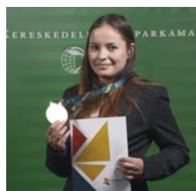
LUNCZ LILI KERESKEDŐ