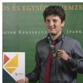
KOVÁCS ISTVÁN ÉPÜLET- ÉS SZERKEZETLAKATOS