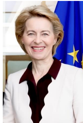
Ursula VON DER LEYEN , Európai Bizottság Elnöke