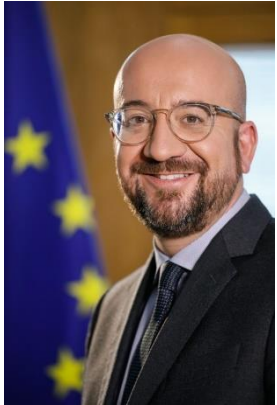
Charles MICHEL , Európai Tanács Elnöke