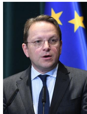
VÁRHELYI Olivér, Európai Bizottság Szomszédáspolitikai és bővítési Biztos