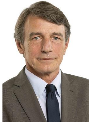
David SASSOLI , Európai Parlament Elnöke