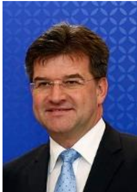
Miroslav LAJČÁK , EU különleges képviselője Belgrád – Pristina párbeszéd és a Nyugat-Balkán ügyekben