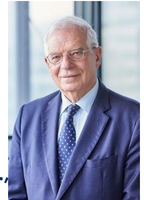
Josep BORRELL , EU külügyi és biztonságpolitikai főképviseelője, Európai Bizottság alelnöke