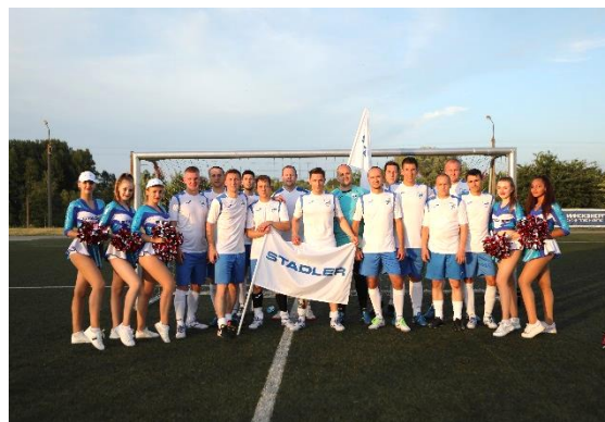
Кубок бизнеса по футболу и команда «Штадлер Минск»