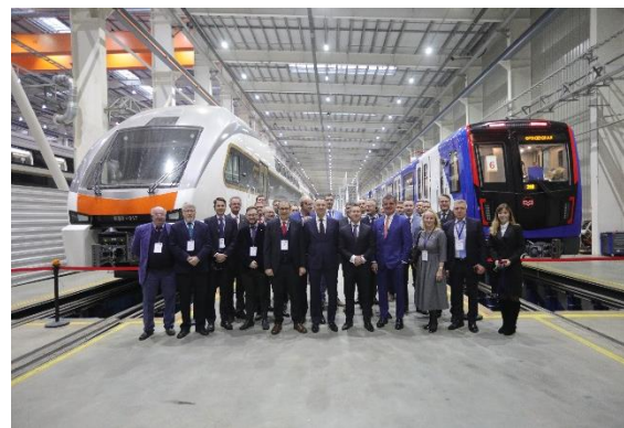
Белорусско-швейцарский Деловой Совет