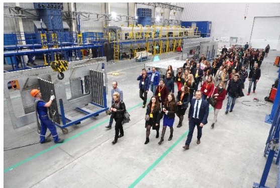
Профориентационные встречи и производственные экскурсии для молодёжи