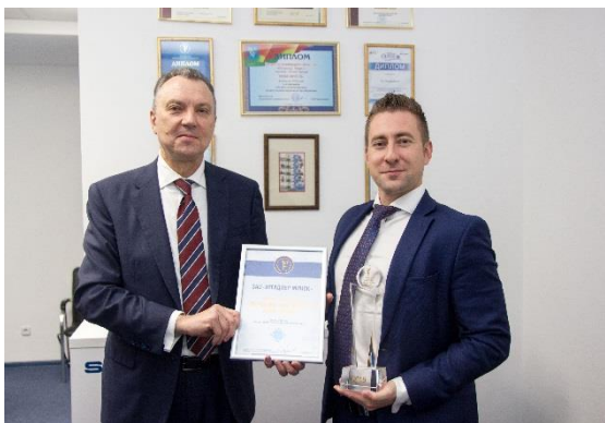
Лучший экспортёр 2019 года в номинации «Машиностроение и металлообработка»