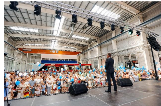
День открытых дверей и день семьи