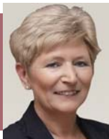
Kissné Horváth Marianna SALDO Zrt.

Az új szakképzési rendszerhez kapcsolódóan számos területen pontosítást, jogalkotói magyarázatot igényelt a 2021. január 1-jétől hatályba lépett szabályozás, azaz a szakképzési hozzájárulási kötelezettséggel szemben érvényesíthető adócsökkentő tételek gyakorlati alkalmazása. A következőkben néhány már pontosított szabályt mutatunk be.