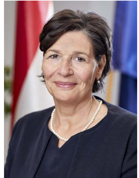
PÖLÖSKEI GÁBORNÉ az Innovációs és Technológiai Minisztérium szakképzésért felelős helyettes államtitkára

hogy számukra milyen nagy előnyt jelent a képzésben való részvétel, hiszen a saját jövőendő munkaerőbázisukat teremthetik meg, ugyanakkor a költségeik egy részét adó-visszatérítés formájában megkapják az államtól. Kedvező, hogy a legkorszerűbb technológiákat alkalmazó vállalatoknál az oktatók továbbképzése is megoldható. A duális képzésben új lehetőséget jelentenek az ágazati képzőközpontok, amelyekkel főként a kkv-k duális képzésben való részvételének növelését szeretnénk elérni. A gazdasági kamara eddig tizennyolc ágazati képzőközpontot vett nyilvántartásba és további nyolc van még folyamatban. Az új képzési környezet a tagok számára együttműködési lehetőséget teremt, feloszthatják egymás között a közös tananyagot. Bízunk benne, hogy ennek eredményeként az ágazati képzőközpontokban a lehető legmagasabb képzési színvonal érhető el. Ugyanakkor az új forma előnye, hogy a tagokat nem terheli adminisztráció, munkabérfizetési kötelezettség és a szakirányú oktatásból származó bevételük jól tervezhető.