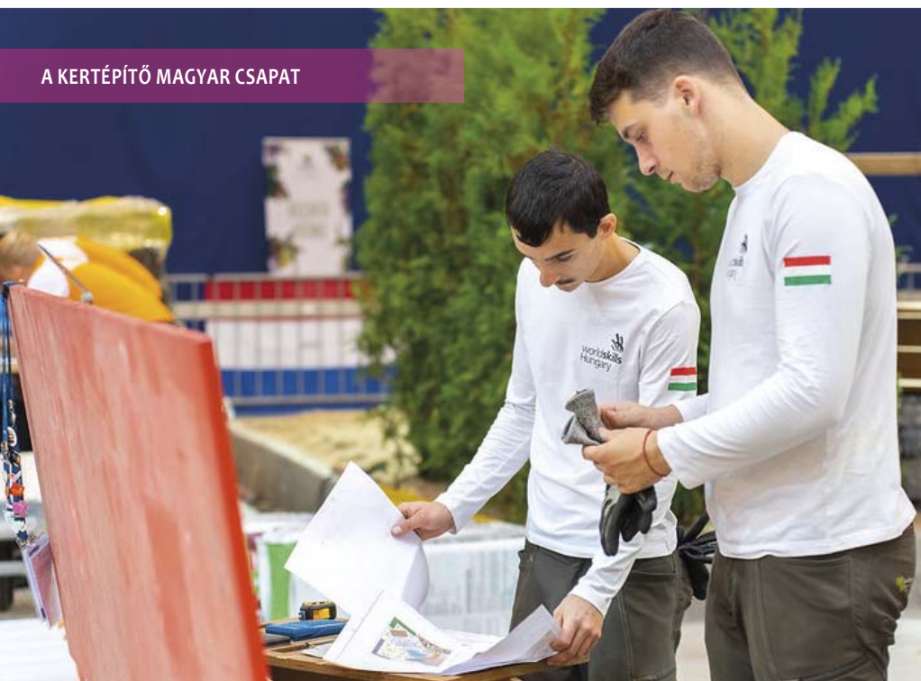
A KERTÉPÍTŐ MAGYAR CSAPAT

– Nagyon szeretem a munkám. A világbajnokság jó motiváció, azt is megmutatta, hogy még rengeteg a tanulnivalóm – tette hozzá.